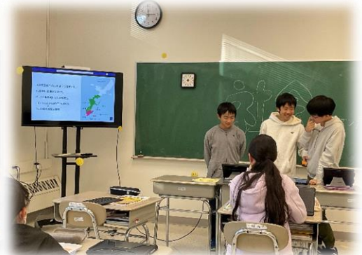
琉球王国との交流