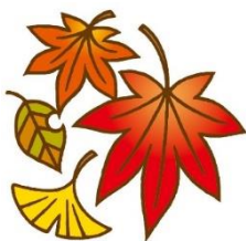
がんばった 外体育