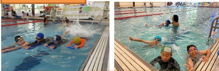
2回の水泳教室でたくさん泳ぎ、泳力を高めました！