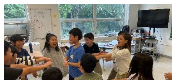
学活 お別れ会の様子