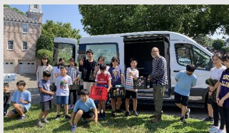
【みんなで食料品をお渡ししました】