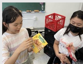
【賞味期限の確認中】

初等部・中等部のコミュニティサービス委員会の皆さん、事前の広報活動から集められた品物の確認まで大変お疲れさまでした。